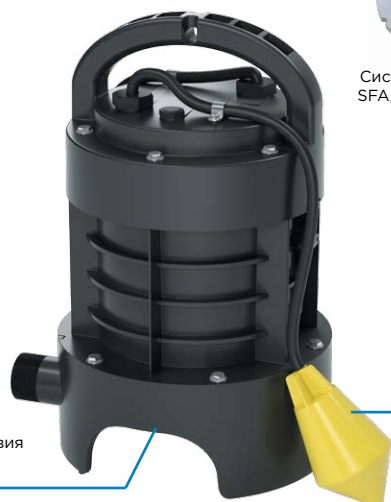
НАДЕЖНОСТЬ Дробильные лезвия ProX K2