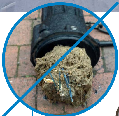
Заблокированный насос без системы измельчения

Засоренные трубы и незасоренные, благодаря использованию системы измельчения